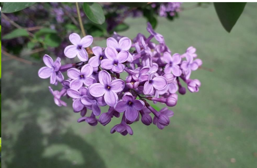
Blühende Grüße aus dem Schulhof